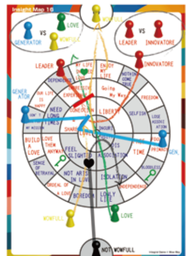
insight-Map HP( http://www.wowway.co.jp/insight-Map )より引用。